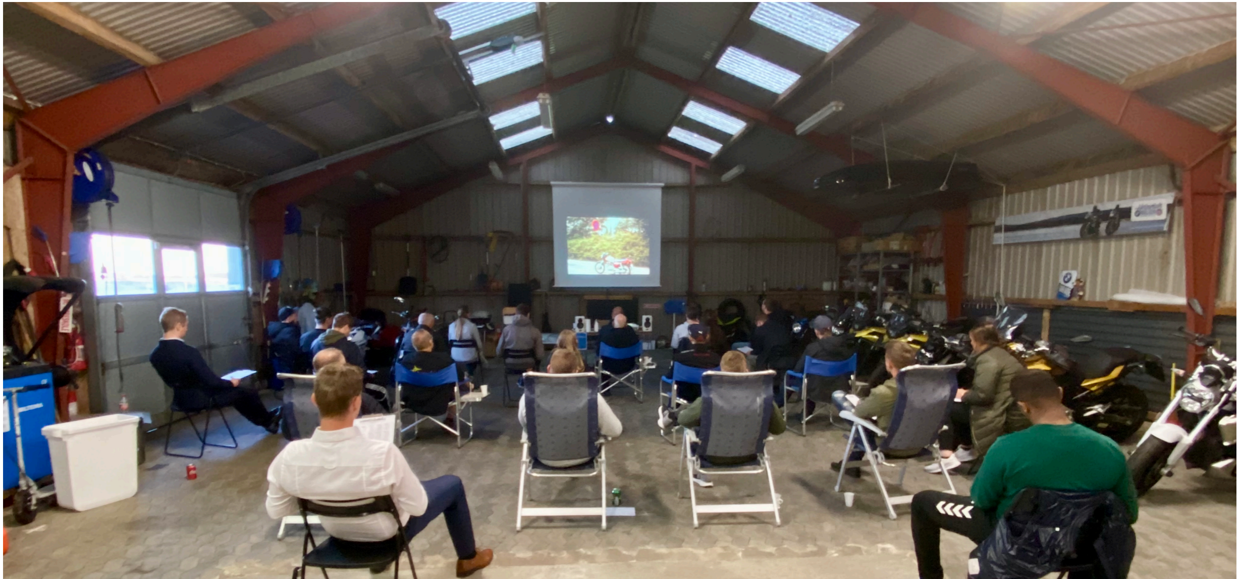
"TEORIOKALET" er midlertidigt i vores garage grundet corona. Det er meget autentisk - og også lidt koldt!

På Svendborgvej 18 har vi lækre store teorilokaler. Desværre er de ikke store nok til at overholde nuværende krav til kvadratmeter og afstand. Derfor kommer teoriundervisningen til at foregå i vores store hal.